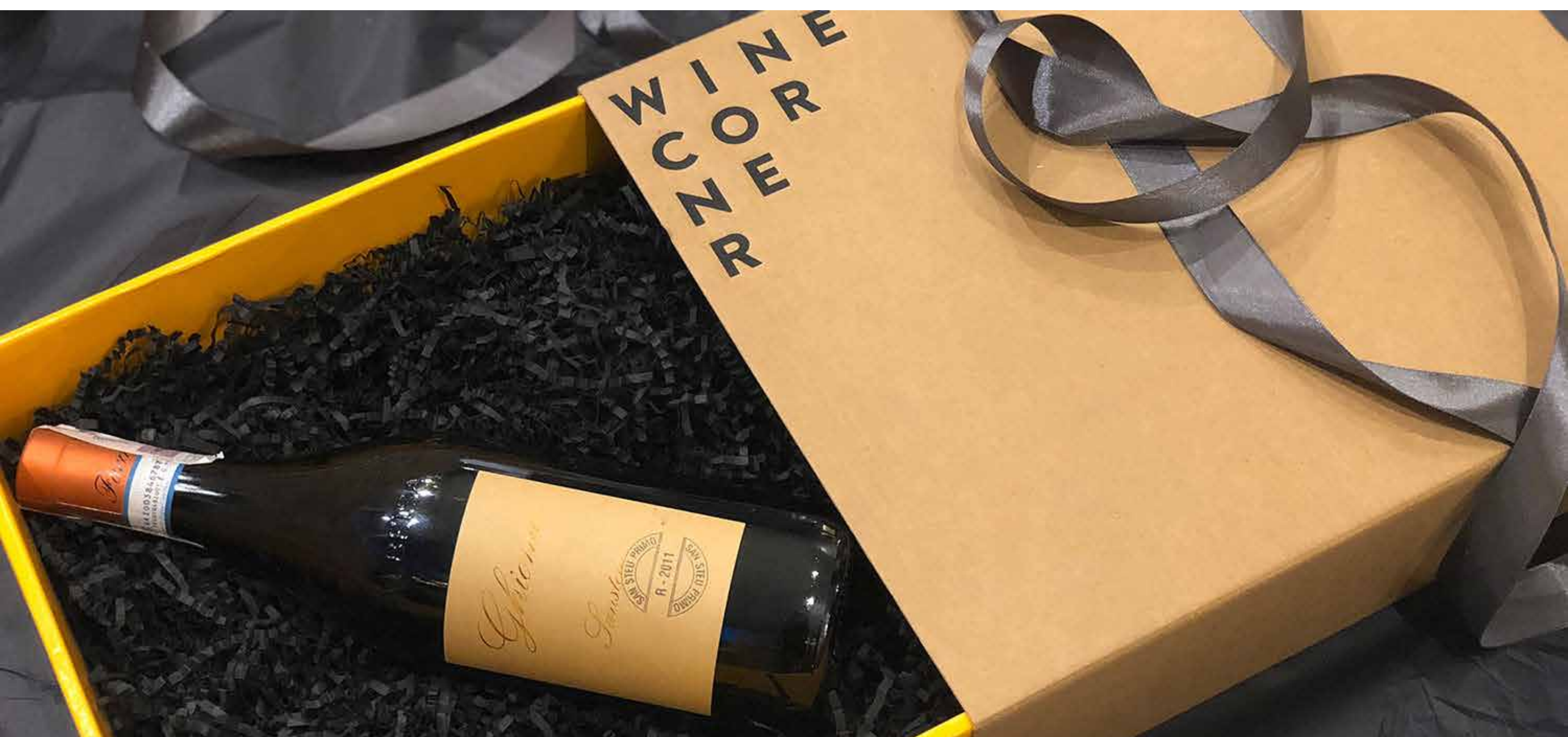
Pudełko rozsuwane "Wine Corner" na 3 butelki wina (lub dowolny zestaw prezentowy) Cena: 40 zł