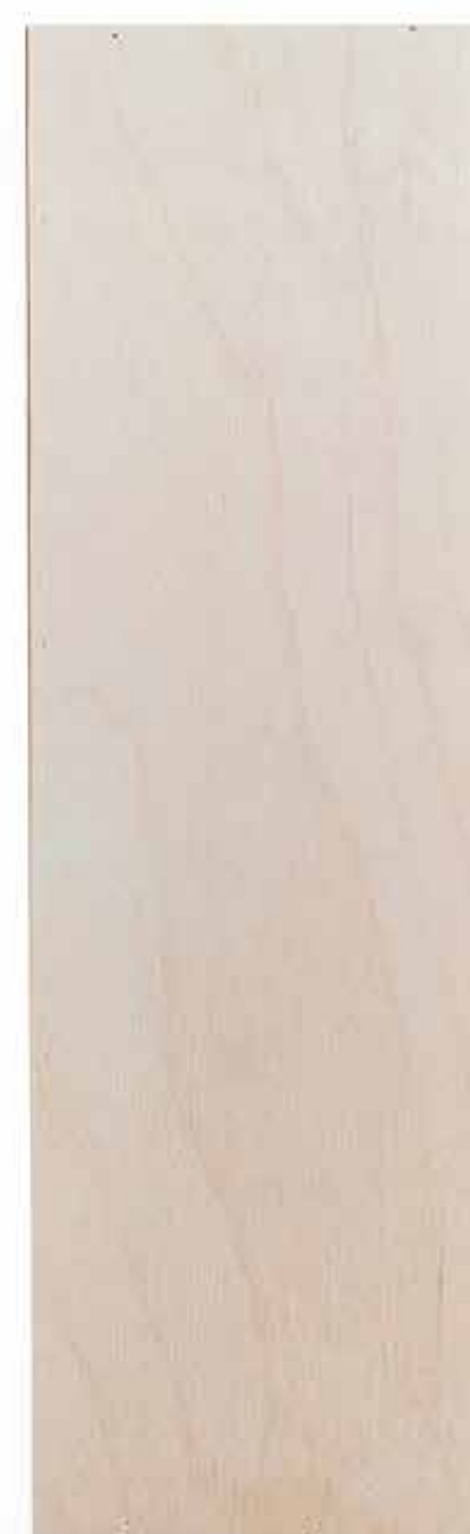
Skrzynka drewniana na jedną butelkę Cena: 35 zł