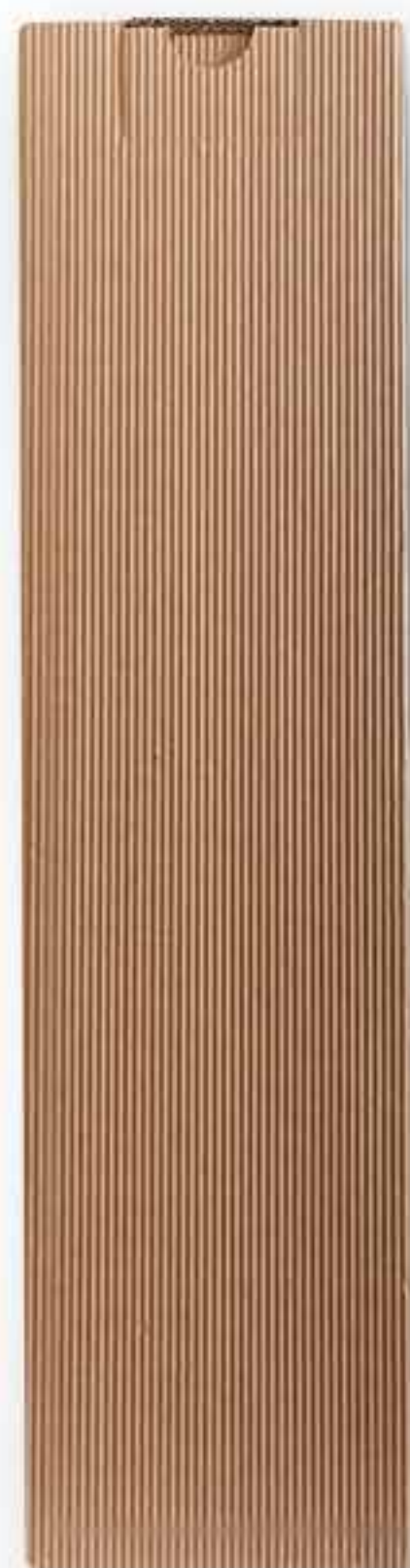
Pudełko kartonowe pojedyncze, mniejsze Cena: 8 zł