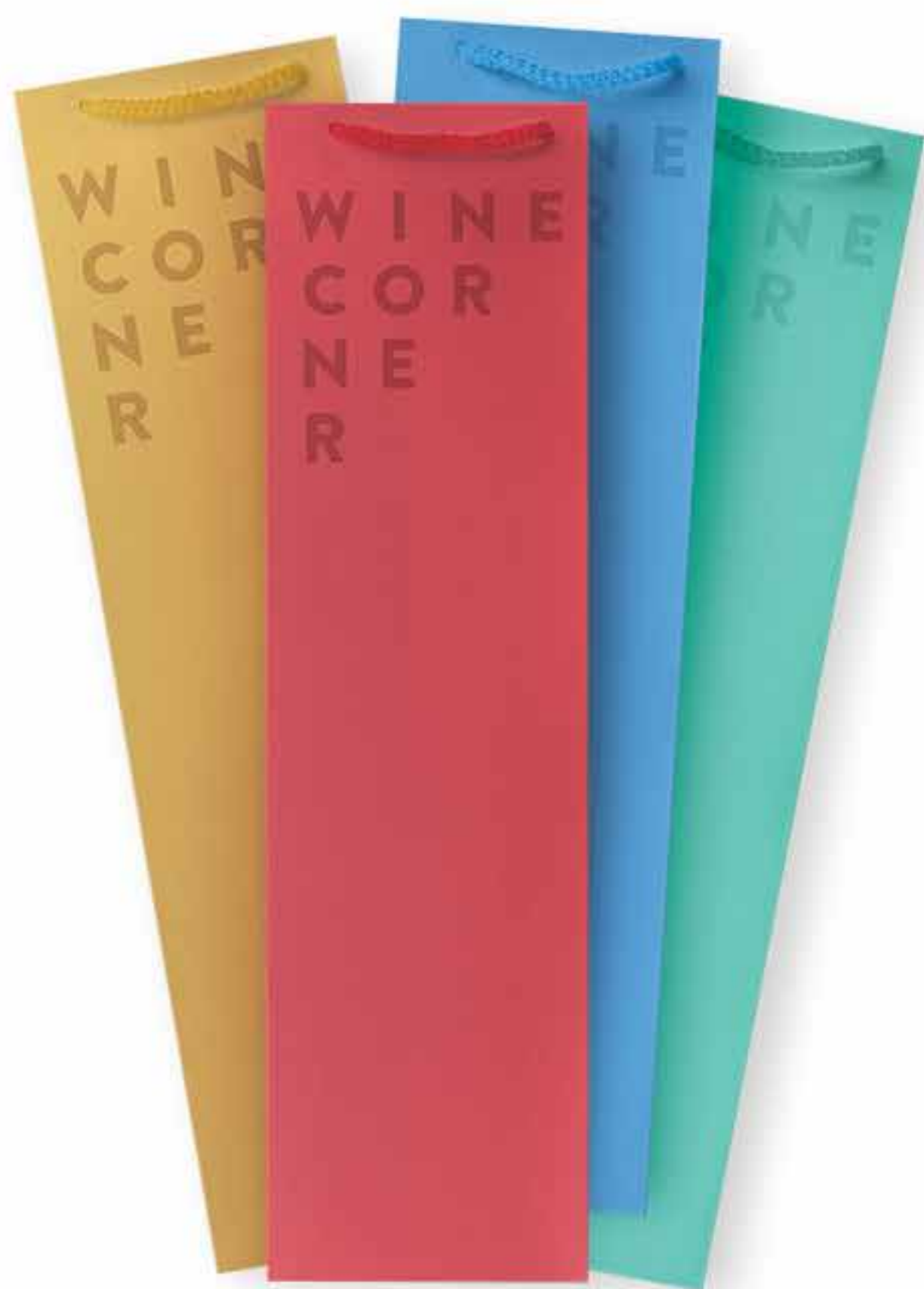
Torebka kolorowa pojedyncza Cena: 5 zł